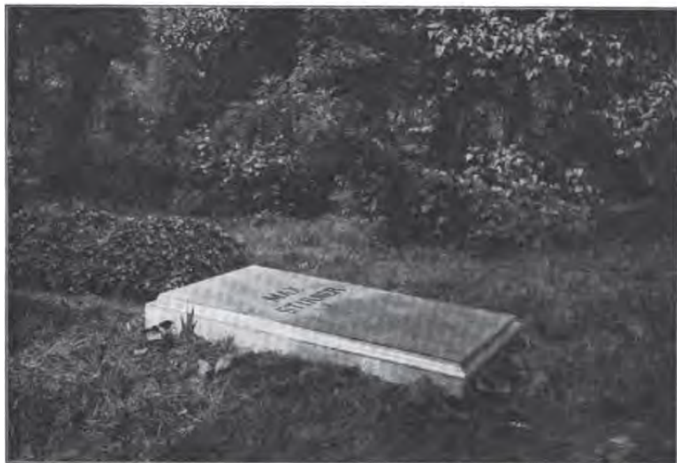
Phot. F. Albert Schwartz, Berlin. 1897.

MAX STIRNER'S GRAB auf dem Sophienkirchhof in Berlin (heute von neuen Gräbern umgeben)