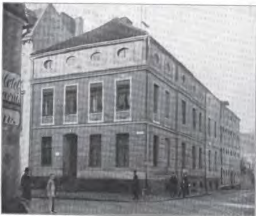
Kulm. 1906.