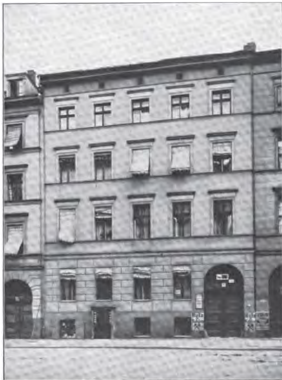
Phot. F. Albert Schwartz, Berlin. 1897.